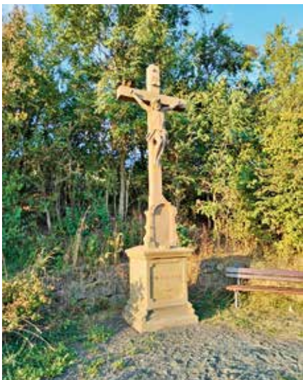
Saniertes Steinkreuz