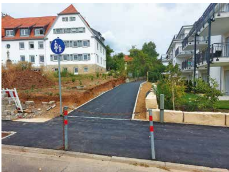
Neuer, barrierefreier Fußgängerweg