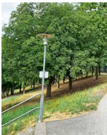
Bestandsleuchten am Schulberg