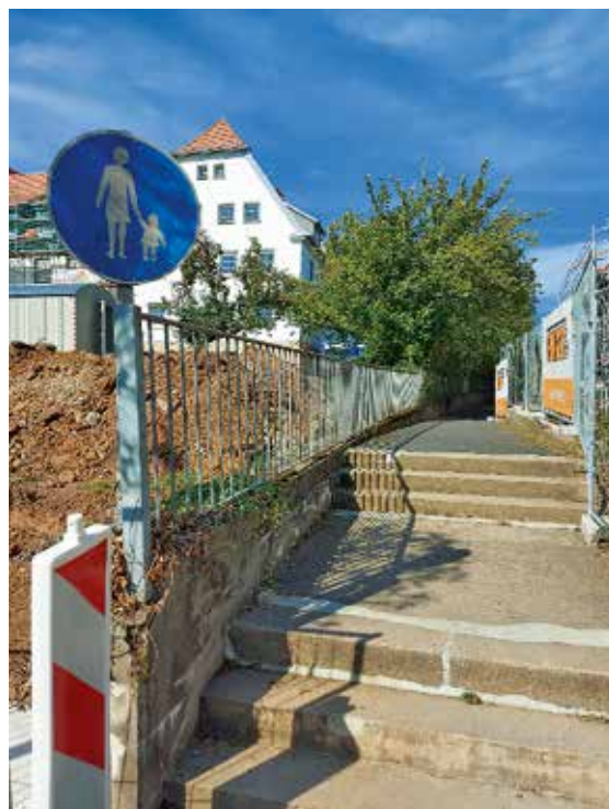
Alter Fußgängerweg mit Treppenanlage

Die Umbaumaßnahmen konnten im August 2022 umgesetzt werden.