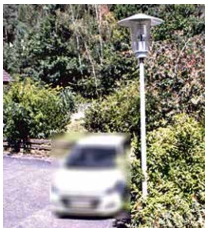
Bestandsleuchten im StT Lebenhan

Über den Zeitpunkt der Umsetzung können derzeit noch keine Angaben gemacht werden, da die Stadt Bad Neustadt an der Saale für diese Umrüstungsmaßnahmen einen Antrag auf Gewährung einer Bundeszuwendung durch das Bundesministerium für Wirtschaft und Klimaschutz beantragt hat. Die Ausschreibung, Vergabe und Durchführung der Maßnahme ist somit erst nach Erhalt des erhofften Förderbescheids möglich.