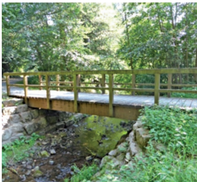
BW 16 Leutershauser Straße – ehemaliger schadhafter Holzüberbau (Länge 9,05 m, Gesamtbreite 1,90 m)

Die beiden Fußgängerstege „Leutershauser Straße“ und „An der Linde“ wurden in Holzbauweise in den 90er Jahren errichtet. Im Rahmen der Hauptprüfung der Brückenbauwerke im November 2014 wurden erhebliche Mängel bzw. Schäden an den beiden Holzbauwerken festgestellt, so dass ein Rückbau und die Erneuerung der beiden Brückenbauwerke unumgänglich waren. Die Trägerkonstruktion, der Bohlenbelag und die Holzgeländer waren von starkem Pilzbefall angegriffen. Die Stand- und Verkehrssicherheit der Stege war nicht mehr gewährleistet. Die stark beschädigten Holzüberbauten sind durch den städt. Bauhof zurückgebaut und entsorgt worden. Die weiteren Arbeiten wurden von der Firma SST Steinindustrie, Schwarza durchgeführt. Hierzu gehören die Erneuerung der Widerlager und Auflagerbänke in Fertigteilbauweise, das Liefern und Einbringen der Aluminiumkonstruktionen der Überbauten mit einer Länge von je 10,00 m und die erforderlichen Erdarbeiten und Anpassungen der Böschungsbefestigungen in den Auflagerbereichen. Die bestehende Wegeführung wurde im Zuge der Maßnahme wieder hergestellt und angepasst. Die 4 Leuchten neben den Stegen wurden im Zuge des erforderlichen Ab- und Wiederaufbaus durch neue LED-Leuchten ersetzt. Die Baukosten für beide Überbauten belaufen sich auf ca. 145.000,00 € incl. Rückbau durch den städt. Bauhof und Erneuerung der Beleuchtung durch die Stadtwerke Bad Neustadt.