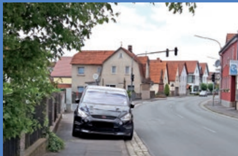
Parkende Fahrzeuge auf dem Gehweg