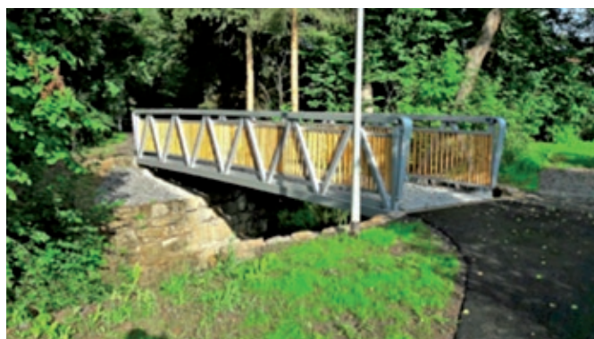
BW 17 An der Linde – neue Aluminium-Tragbrücke aus Hohlfachprofilen mit Holzgeländerstäben (Gesamtlänge ca. 10,00 m, Gesamtbreite 2,28 m, Gesamthöhe ca. 1,51 m – Geländer 1,30 m, der Brückenbelag besteht aus Hohlfachprofilen mit einer geräuschkämmenden und rutschfesten Beschichtung)