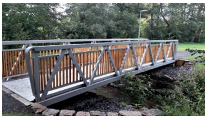
BW 16 Leutershauser Straße – neue Aluminium-Tragbrücke aus Hohlfachprofilen mit Holzgeländerstäben (Gesamtlänge ca. 10,00 m, Gesamtbreite 2,28 m, Gesamthöhe ca. 1,51 m – Geländer 1,30 m, der Brückenbelag besteht aus Hohlfachprofilen mit einer geräuschkämmenden und rutschfesten Beschichtung)