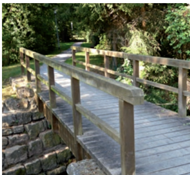
BW 17 An der Linde – ehemaliger schadhafter Holzüberbau (Länge 6,75 m, Gesamtbreite 1,90 m)