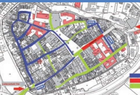
Bauverlauf in der Altstadt