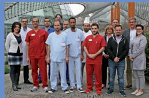
Flüchtlinge werden fit fürs Berufsleben