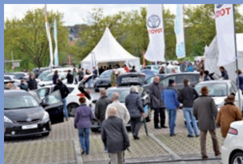
7. Fahrzeugschau Elektromobilität